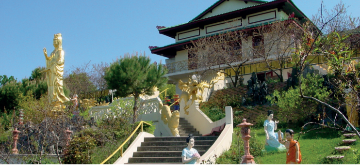
La pagode Thien Minh et son parc, rue de Cuzieu

Situé chemin des Sources, le ruisseau - et ses 7 sources - compte la présence d'aulnaies, de nombreux oiseaux et même une famille de blaireaux. Quant au chemin des Sources, c'est l'un des derniers lieux du Grand Lyon intra muros où il est possible de trouver un troupeau de vaches en plein champ.