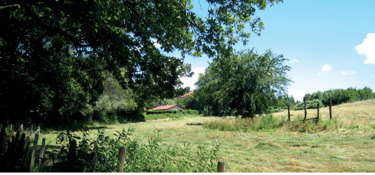
Le ruisseau des Razes, chemin des Sources

Ces dépliants pédestres ont été conçus et réalisés par la Ville, en collaboration avec l'Agupe. Ils sont disponibles en téléchargement sur notre site internet : www.saintefoyleslyon.fr Bonne découverte !