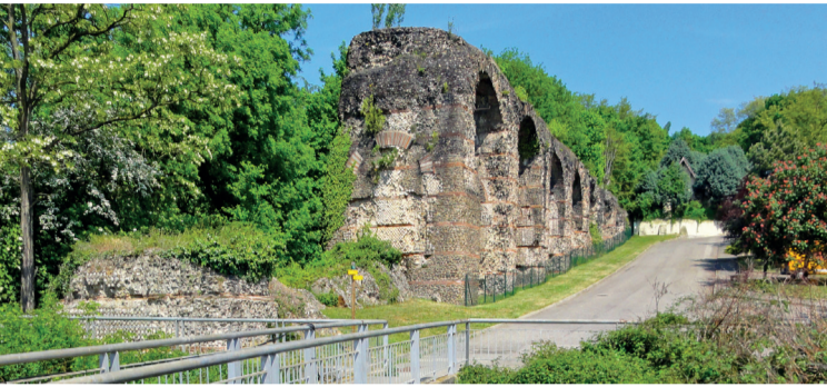
Le pont siphon de Beaunant, 3 e plus long aqueduc romain

Les meilleurs crus étaient ceux des territoires des Balmes, des Chassagnes et de Montray. Le patrimoine vignoble fidésien est en train d'être sauvegardé grâce à la plantation d'une nouvelle vigne à Montray géré par l'association « Les coteaux de Montray » (4/5) .