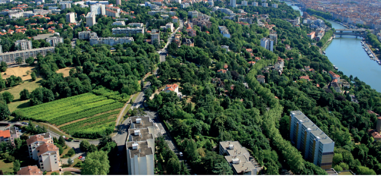
Les côteaux fidésiens, réputés pour leurs vignes aux siècles derniers