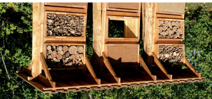
Les hôtels à insectes, chemin des Hauts du Bois (21)

C'est un parc « à l'anglaise », construit en partie sur les fossés du fort. Il fut ouvert au public en 1947. Équipé d'un skate parc, un fitness parc et de nombreux jeux d'enfant, c'est le parc le plus fréquenté de Sainte Foy-lès-Lyon.