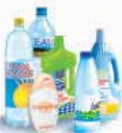
Bouteilles et flacons plastiques

En vrac, dans le bac vert, déposez uniquement :