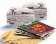
Journaux, magazines, papier

Déposez le verre dans le conteneur le plus proche :