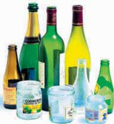
Verre seulement, sans couvercle ni bouchon. Pas de vaisselle, pas d'ampoule...

Déposez le verre dans le conteneur le plus proche :