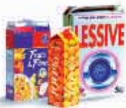
Cartons et cartonnets