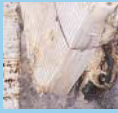
Vieux meubles, litterie