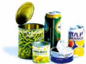
les boîtes de conserve et les cannettes

je les dépose en vrac et vides dans le bac vert