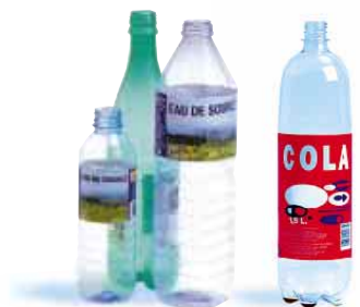
les bouteilles d'eau, jus de fruit, soda, etc...