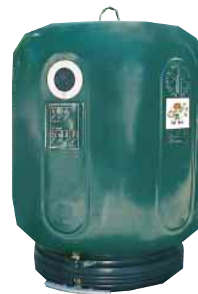
DES SILOS à disposition sur la voie publique

Près de chez vous, se trouve un silo réservé au verre.