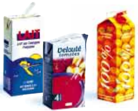
les briques alimentaires