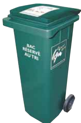
UN BAC individuel ou collectif

bouteilles et flacons en plastique, boîtes métalliques, cannettes et aérosols, briques alimentaires, boîtes et emballages en carton, journaux, magazines et prospectus