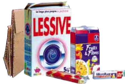
les boîtes et les emballages en carton