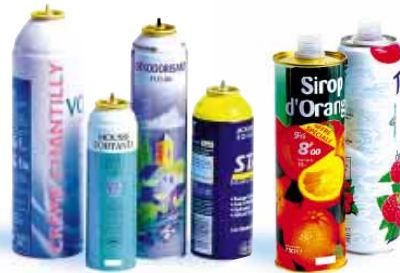
les aérosols et les flacons