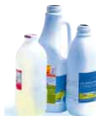
les bouteilles de lait, jus de fruit, etc...