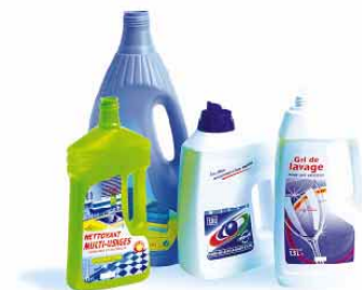
les bouteilles d'adoucissant, de lessive, de liquide vaisselle, de javel, etc...