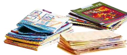
les journaux, les magazines, les prospectus